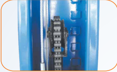
▲ โช้ขนาดใหญ่ ทนทานกว่า