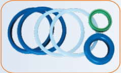
▲ โอริงผลิตจากประเทศญี่ปุ่น